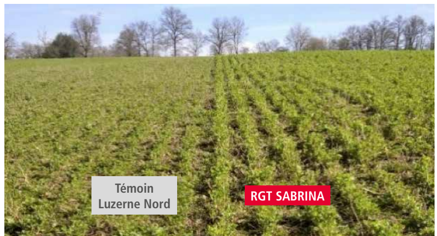
Témoin Luzerne Nord

RGT SABRINA présente un port très dressé et une belle hauteur de végétation.